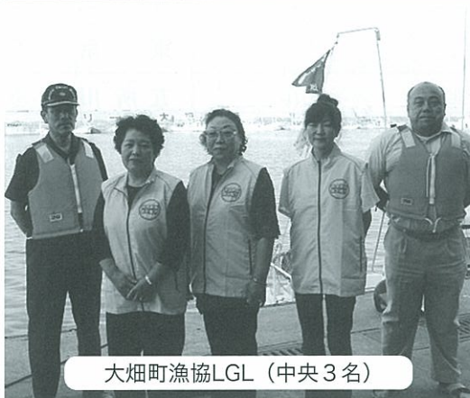
大畑町漁協LGL (中央3名)

家庭から救命胴衣着用を推進するため、漁協女性部を対象に、LGL(ライフガードレディース)委嘱活動を実施しております。