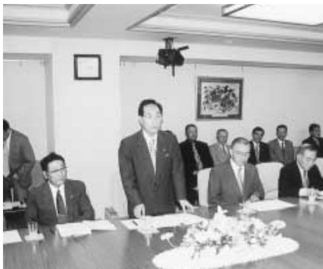
へい死対策について陳情する植村県漁連会長