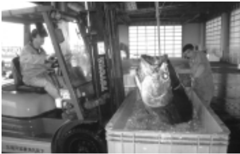
風間浦村沖で水揚げされた本マグロ