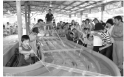
下風呂温泉街で行われているイカ様レース

今回は、風間浦村内の3漁協「蛇浦漁協」「易国間漁協」「下風呂漁協」の皆さんをご紹介します。